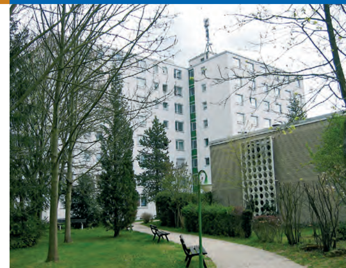
Projektbeispiel Sanierung: Seniorenzentrum in Eschwege